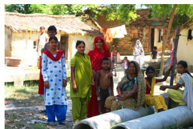
LES HABITANTS DU VILLAGE ATTENDENT ...

il reçoit les soins médicaux appropriés. Même après presque dix ans d'existence, le concept de l'assistance sanitaire mobile connaît toujours un immense succès : les UMM de Bhadohi ont été cédées à l'organisation partenaire, et Label STEP poursuit les projets dans les deux autres régions. Jusqu'à présent, plus de 140'000 personnes ont pu être soignées !