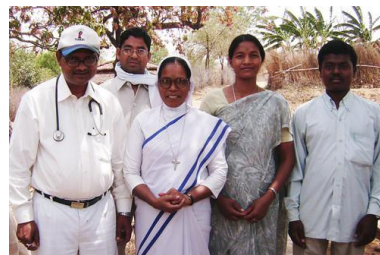
ET LES PROFESSIONNELS EXPÉRIMENTÉS ...