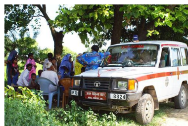
LE CABINET MÉDICAL VOLANT ...