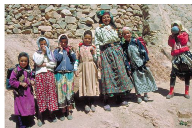
ENFANTS ET FEMMES D'AMASSINE